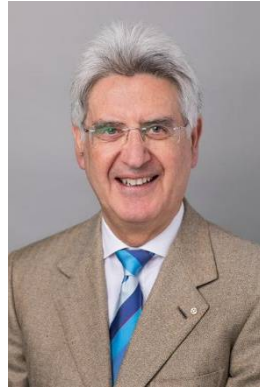
2025-26年度 フランチェスコ・アレツツォRI会長

例会予定 12月10日 外部卓話 常総市生活環境課 12月17日 休会 12月24日 忘年例会振替 12月31日 休会