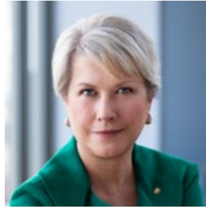
2022-23年度 ジェニファー・ジョーンズ RI会長