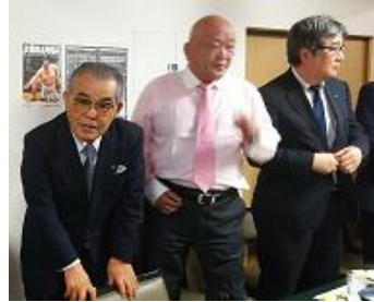
中締め・送り出しの挨拶