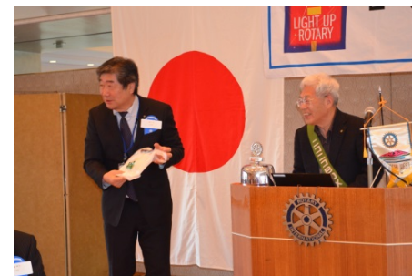
ニコニコ抽選で水海道クラブが当選 11月15日(土)