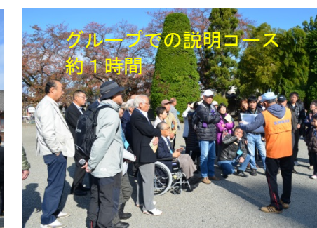
比較的空いていましたが時間とともに人の波が増えました