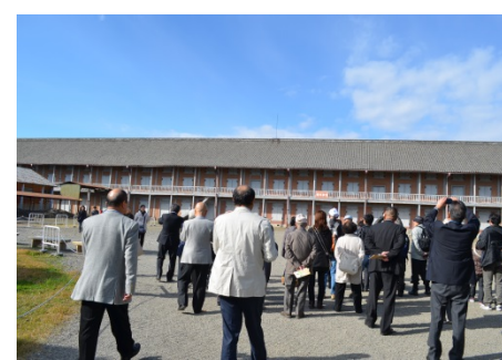
AM9 時 30 分富岡製糸場に到着