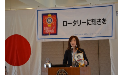
女性幹事らしい独特のアナウンス