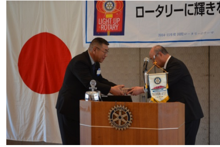
富岡製糸場紹介 DVD を 12 本頂く