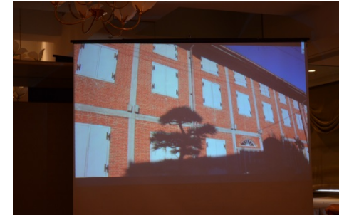
例会のメインは富岡製糸場 DVD 鑑賞