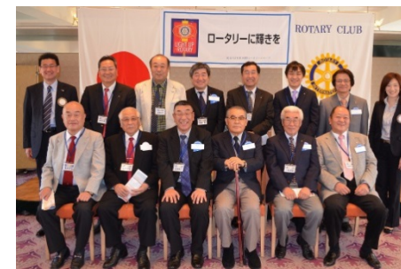
例会終了後に記念写真