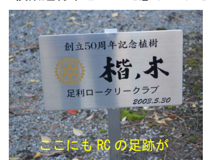
ここにも RC の足跡が