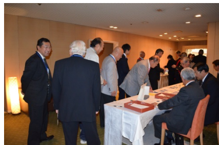
AM12 時 10 分に例会会場へ 入口にてメイク料 ニコニコを払う