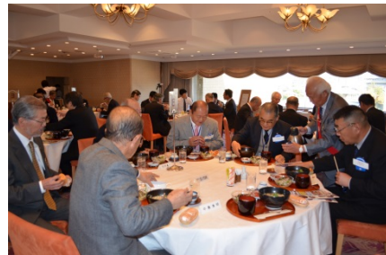
食事は山菜うどんと鮭とわかめの混ぜご飯 優雅な雰囲気です 点鐘「会長の時間」と記されていました