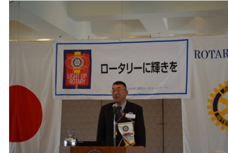
武藤会長のあいさつ