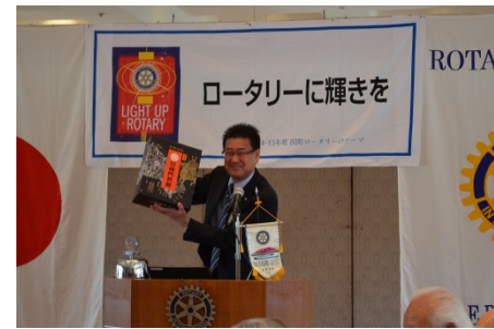
お土産「将門煎餅」の披露