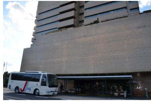
AM8 時 30 分に出発 11 時 30 分 例会場の群馬ロイヤルホテルに到着