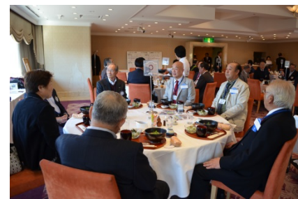
3 名ずつテーブル席にて情報交換