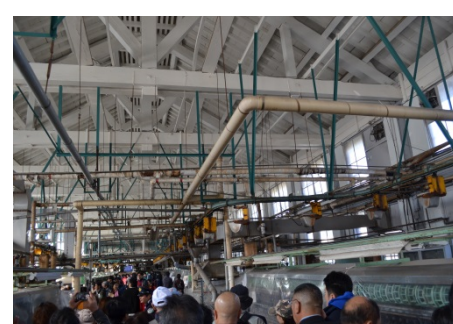
場内外で世界遺産としてのおもてなしが模索進行中といった感じでした