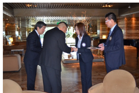
前橋西 RC 会長幹事がお出迎え